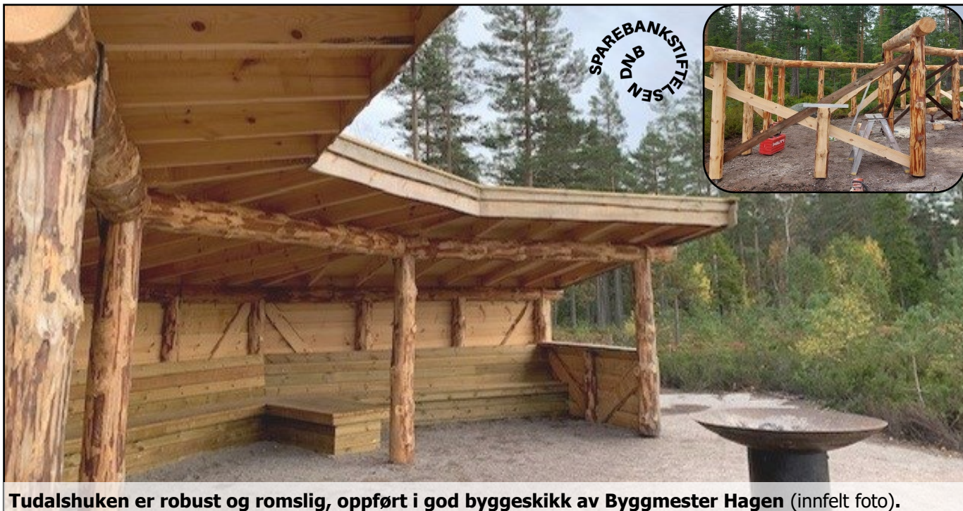
Tudalshuken er robust og romslig, oppført i god byggeskikk av Byggmester Hagen (innfelt foto).

Friluftsrådet har etablert et nytt nærturområde i Siljan, i kort gangavstand fra skole, barnehage og boligområde. En stor gapahuk skal gjøre uteundervisning lettere, og rasteplasser med ildsteder sørger for sikker og hyggelig bålkos. Snart setter vi også opp nye infotavler og en kreativ natursti.