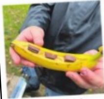
NAM: Banen med sjokolade tilberedes på skolegården.

Da skolen så værmeldinga for mandag, måtte de snu seg rundt.