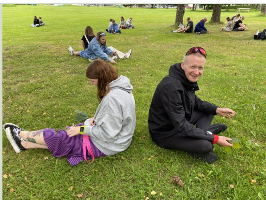
Ivrig lærere fra Gimsøy skole på praktisk kurs i uteaktiviteter

Grenland friluftsråd samarbeider med 12 skoler i fire av våre fem medlemskommuner. Disse skolene har utnevnt to ressurspersoner fra hver skole som har en viktig rolle i å følge opp satsingen. I tillegg til at friluftsrådet har skolebesøk på hver skole hvor vi har kurs for personalet, faglige påfyll og klasseveiledninger, får disse ressurspersonene et kurs over åtte dager som skal gi dem et solid grunnlag for å drive mer og bedre uteundervisning. Første kurssamling gikk over to dager på Hotell Fritidsparken i Skien, og var en god variasjon av teori, praktiske aktiviteter og erfaringsutveksling. Engasjementet fra lærerne var stort, og vi ser tydelig at dette er noe som deltakerne brenner for! Vår rolle fremover blir å legge til rette for at læring i friluft ikke kun er noe som er avhengig av lidenskapen hos enkeltlæreren, men som er en viktig del av skolekulturen og som er forankret hos ledelsen. Neste samling blir i Langesund i mars!