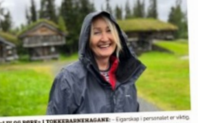
LIV OG RØRE: Full fart når personalt i Tokke-barnehage tok «Liv og Røre»-kurs. – alle er med på dette kurset.